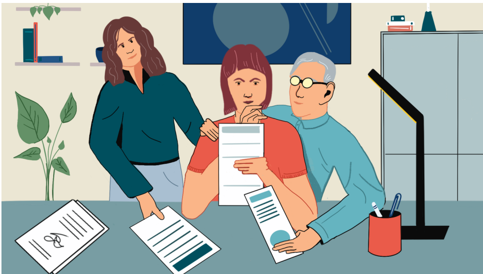
Illustration: Charlotte Eckstein / NZZ

Für viele Arbeitnehmer ist die Pensionskasse der grösste Vermögenswert. Trotzdem achten viele bei der Wahl des Arbeitgebers nicht auf die Leistungen der entsprechenden Vorsorgeeinrichtung – sei es, weil die Materie zu kompliziert oder weil die Pensionierung noch zu weit entfernt ist.